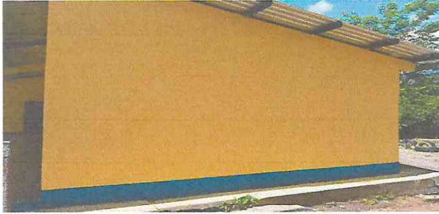
Foto1: Pintura en exterior de aulas